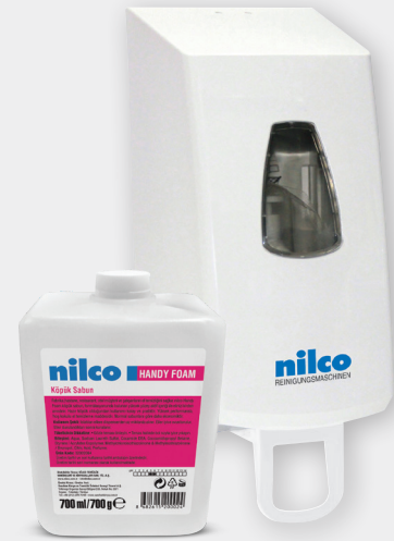
Kartuşlu Köpük Sabun Dispenser 700 ml