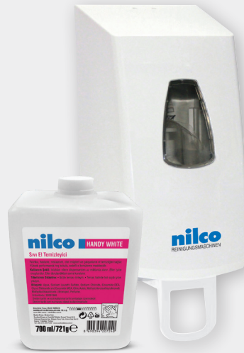
Kartuşlu Sıvı Sabun Dispenser 700 ml