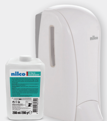
Kartuşlu Şampuan Dispenser 350 ml