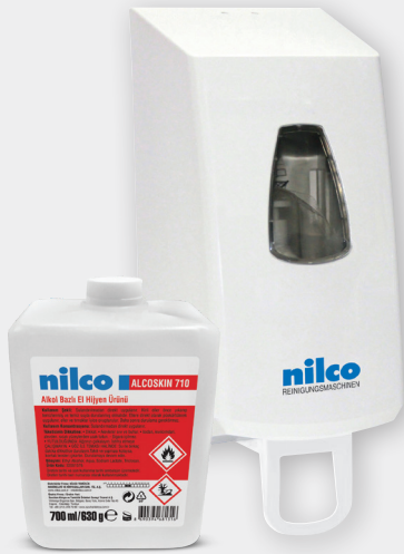
Kartuşlu El Dezenfektanı Dispenser 700 ml