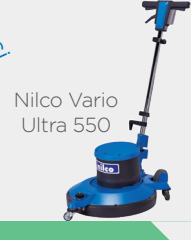
Nilco Vario Ultra 550

MAKİNE ÖNERİSİ Cila sökme, Cilalama ve Parlatma işlemlerinde