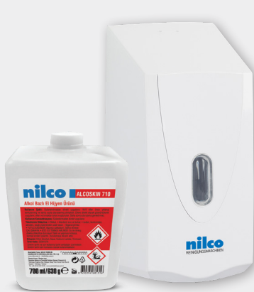
Kartuşlu Sensörlü Köpük / Sıvı / Dezenfektan Dispenser