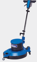
Nilco Vario Ultra 550