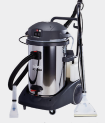
Nilco IC 390